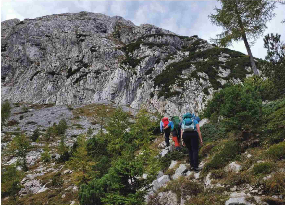
Avtorja sta nas popeljala na goro Monte Zermula.