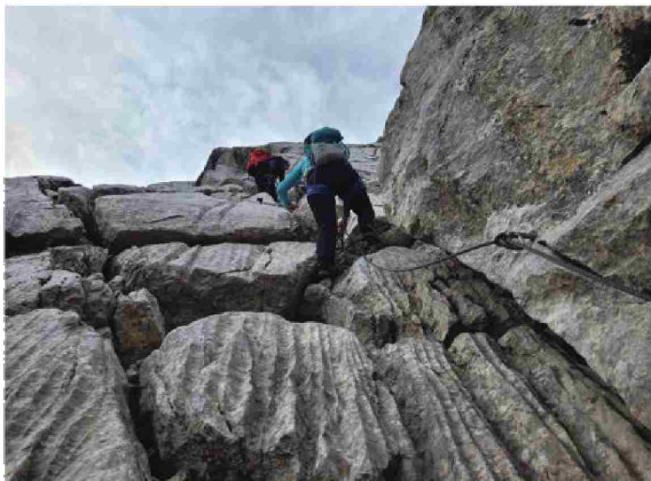
Na Monte Zermulo vodita planinska pot in ferata.